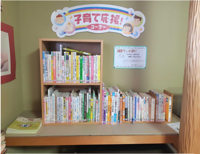
大館市立花矢図書館 「子育て応援！コーナー」