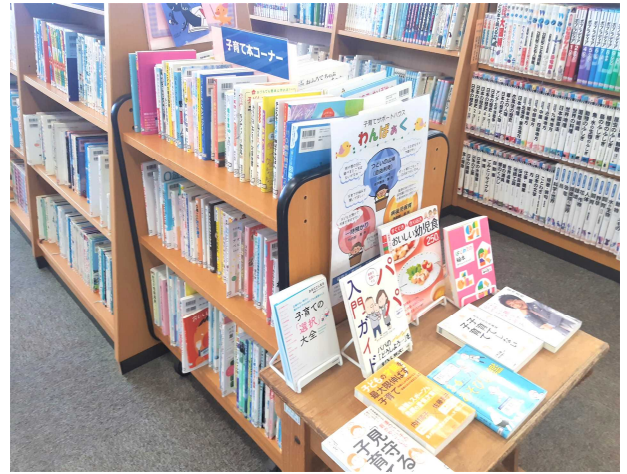
北秋田市鷹巣図書館 「子育て本コーナー」