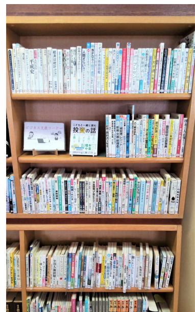
大仙市立西仙北図書館 「ビジネス支援コーナー」