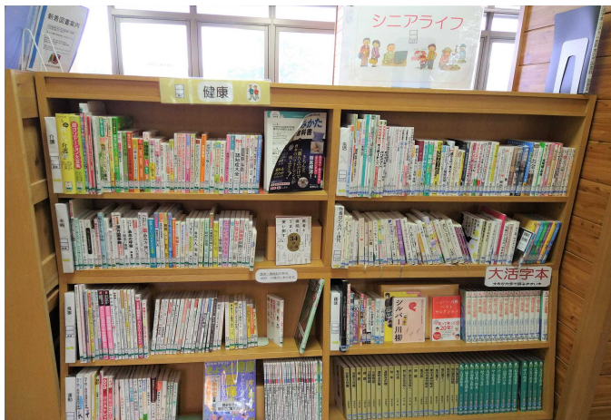
由利本荘市由利図書館 「シニアライフ」コーナー