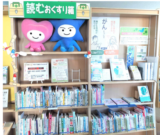
藤里町三世交流館 「読むおくすり箱」